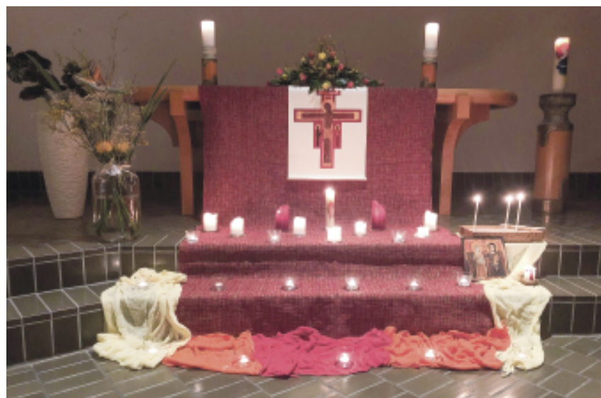
Kerzen im Oeki

Unsere Taizé-Feiern findet einmal im Monat am Mittwochabend um 19.30 Uhr im Ökumenischen Zentrum Kehrsatz statt. Sie finden die Daten in unserem Veranstaltungskalender – im Internet ( www.oeki.ch ), im Pfarrblatt oder im Reformiert. Es würde uns sehr freuen, wenn Sie vorbeischauen!